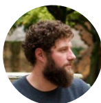
Artisanat Adrien MOJON Mojon Métallerie