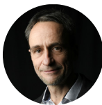
Observatoire de la Commande Publique Emmanuel MALECOT CBCE