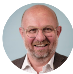
Sociale Nicolas ROIRET BOTTA SAS