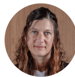
Environnement Marie-Myriam FAVRE CHOPIN SAS